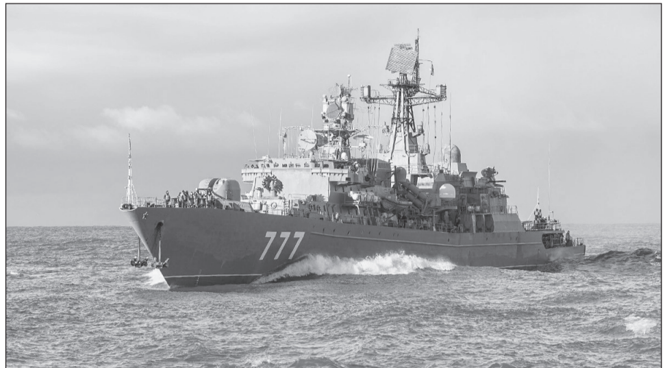
Специалисты завода проводят ремонт корабля в Балтийске.

«Для выполнения работ по сервисному обслуживанию и обеспечению технической готовности корабля мы привлекаем соисполнителей. Активно задействованы и работники «Янтара», а именно специалисты цеха 3. Они успешно выполнили ремонт валопровода, работы предъявлены в части монтажа и при проведении контрольного выхода они будут сданы личному составу. Также монтажно-сдаточный цех был привлечен к работам по монтажу забортных трапов по правому и левому