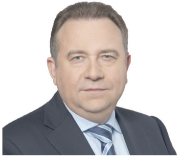
Алексей Рахманов, президент ОСК