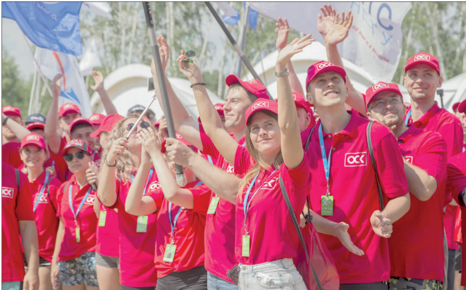
Молодежь «Янтаря» участвует в работе отраслевого «Судостроительного факультета».

В начале июля участники VIII Международного молодежного форума «Инженеры будущего – 2019» сфокусируются на таких актуальных темах, как проектные команды, производственная система и бережливое производство, тренды развития судостроения.