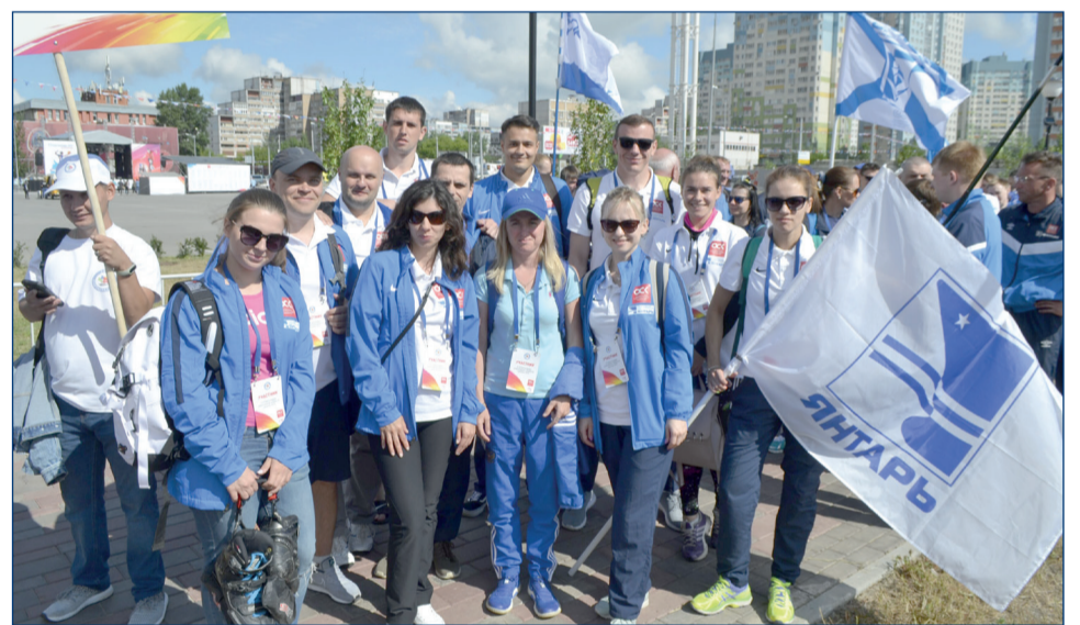
Наши сражались с профессиональными спортсменами и заняли 4 место.

Неоспоримый футбол. От нашего предприятия было 24 человека. Как и все эти пять лет, что существует спартакиада ОСК, лучшего результата мы добились в футболе: из шести игр в пяти мы одержали победу и одну сыграли вничью, не пропустив ни одного гола. Заслуженно заняли первое место. С учетом силы нашей футбольной команды, многие соперники боялись привозить футболистов, потому что не видят смысла соревноваться с нами. «Звездочка» в прошлом году нам проиграла, и в этом году они привезли только волейбольную команду, хотя и грозились в прошлом одержать над нами победу.